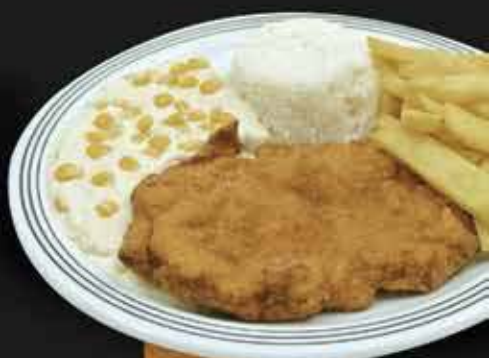
CREME DE MILHO