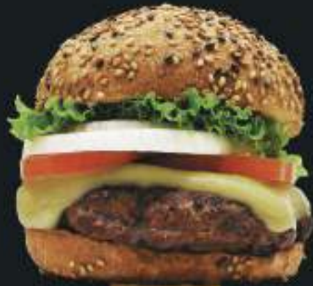
DO CHEFF #2