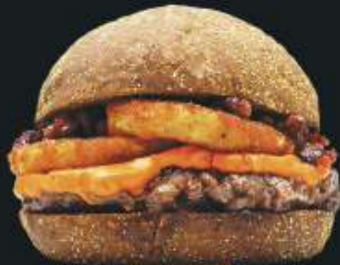
DO CHEFF #4